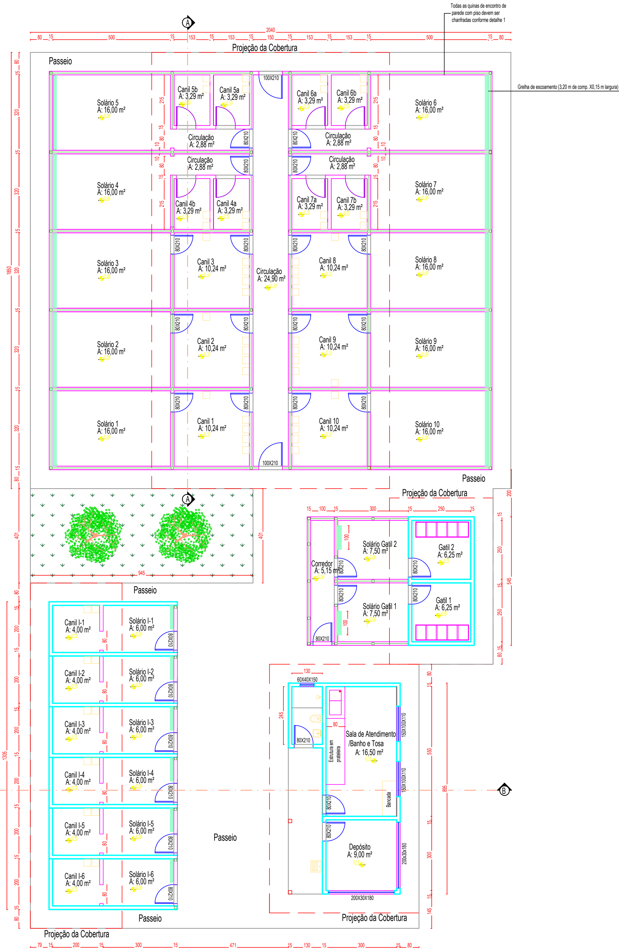
Planta Baixa - Abrigo de Animais Escala 1/95